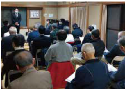
草の根座談会を開催

久しぶりの開催となる、草の根座談会を開催しました。夜間にもかかわらず、たくさんの皆様にご参加頂きました。有難うございました。コロナで約2年振りの開催となりましたが、皆様と顔を合わせて意見交換する意義を、改めて実感致しました。これからも市議の仲間と一緒に、市内各地で開催していきたいと思っております。