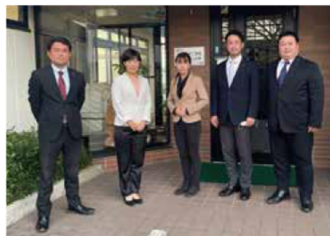
児童養護施設「あいの実」を視察

草の根メンバーと日高市にある児童養護施設「あいの実」を視察で訪問してまいりました。