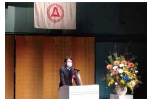
富士見市賀詞交歓会

各事業が少しでも早く完成するよう、埼玉県と富士見市のパイプ役として今年も頑張ってまいります。