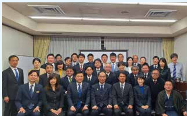
大野県知事と無所属議員の会埼玉のメンバー