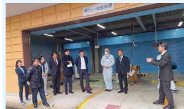
埼玉県計量検定所にて